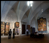
Museu d'Art de Girona

Monestir de Sant Pere de Galligants C. Santa Llúcia, 8 Tel. 972 20 26 32 www.mac.cat