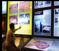
Museu d'Història de la Ciutat

Palau Episcopal Pujada de la Catedral, 12 Tel. 972 20 38 34 www.museumart.com