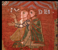
Museu d'Història dels Jueus

C. de la Força, 27 Tel. 972 22 22 29 www.girona.cat/museuciutat