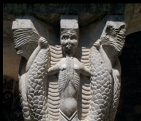
Museu d'Arqueologia de Catalunya-Girona

Dia internacional dels museus / dimarts 18 de maig