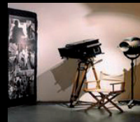
Museu del Cinema

C. de la Força, 8 Tel. 972 21 67 61 www.girona.cat/call